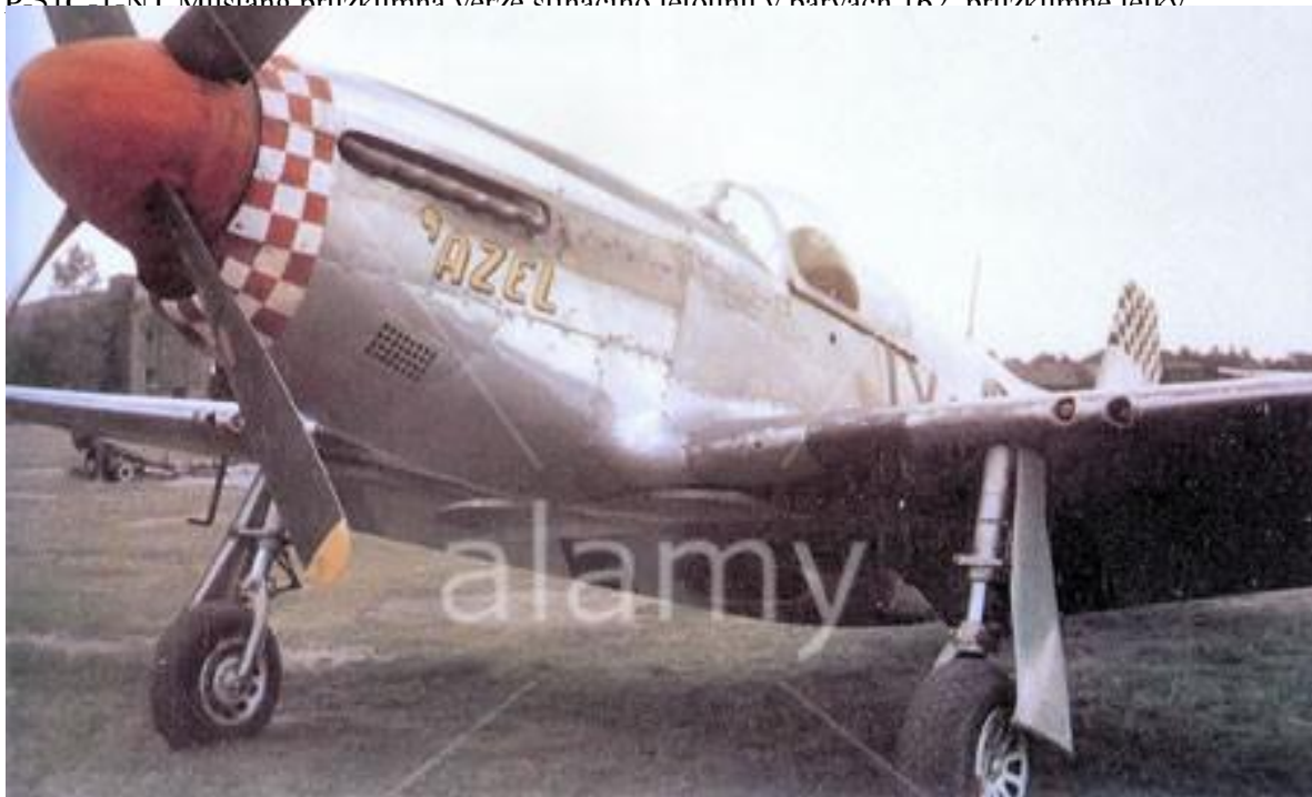
P-51C-1 NT Mustang průzkumná verze stíhacího letounu v barvách 162 průzkumná letka